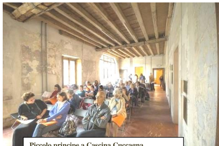
Piccolo principe a Cascina Cuccagna