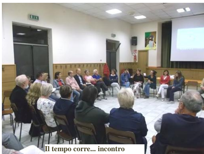
Il tempo corre... incontro