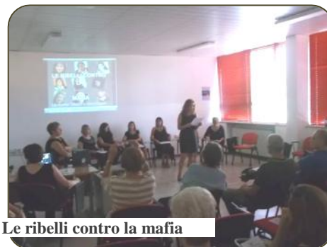
Le ribelli contro la mafia