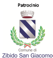
Comune di Zibido San Giacomo