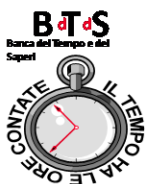
Banca del Tempo di Buccinasco