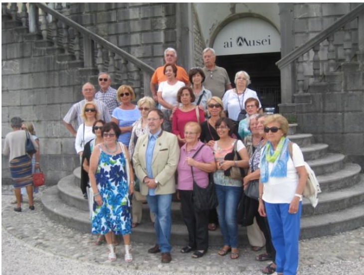
Visita guidata a Udine