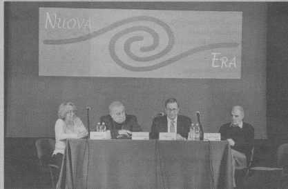
PRIMO CONVEGNO DELL’ASSOCIAZIONE “LA NUOVA ERA”