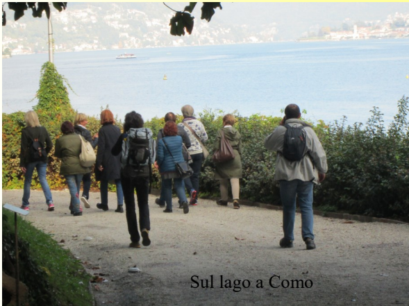
Sul lago a Como