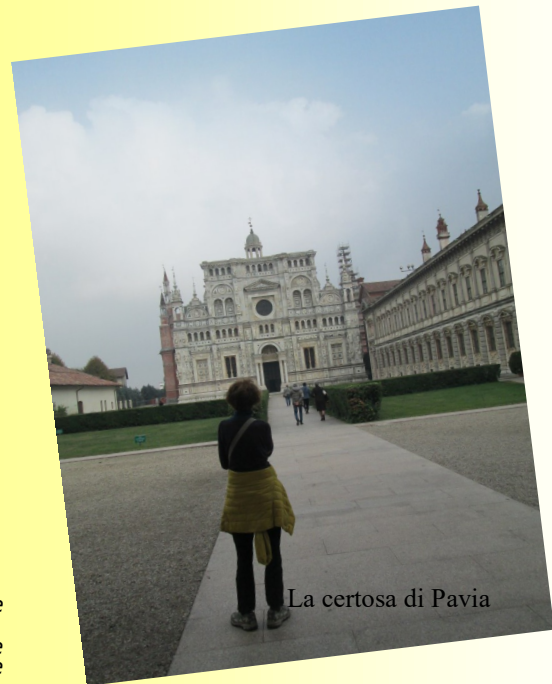
La certosa di Pavia