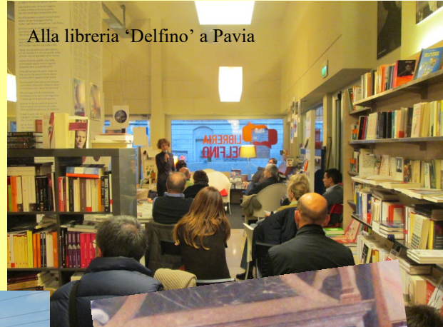
Alla libreria 'Delfino' a Pavia